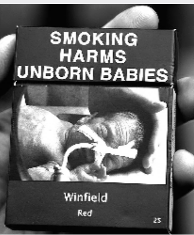
澳大利亚禁止烟草公司在香烟盒上展示其特有标志,规定所有香烟盒必须配以因吸烟导致的健康危害的图片,如溃烂的口腔、失明的眼球以及病弱儿童等警示性图片。

与烟草企业缴纳的税费相比,公众健康显然更为重要。控烟不仅能降低癌症、心脑血管疾病的发病率,而且能减轻国家医疗卫生负担,实现社会效益、经济效益双赢。政府有关部门应当下决心在控烟上动真格,抓落实。